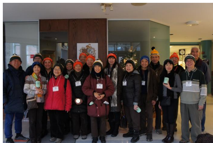
Nhóm CSS Montreal, trước khi khởi hành (2015) CSS Montreal Group collecting for Food Depot in 2015

Tất cả ý kiến và đóng góp xin gửi về - Please email all suggestions to : thuy@videotron.ca