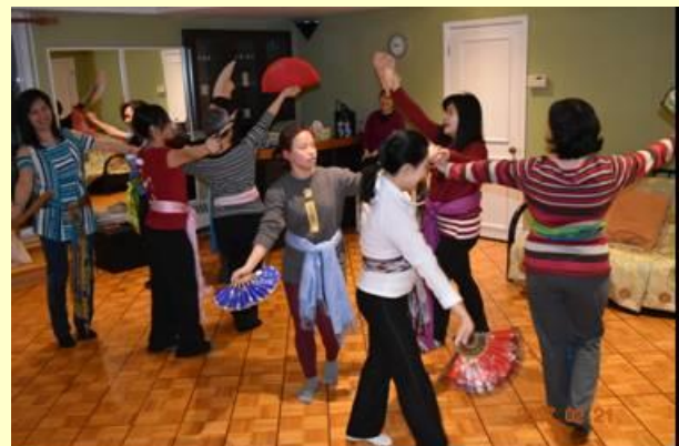
Các chị đang tập múa